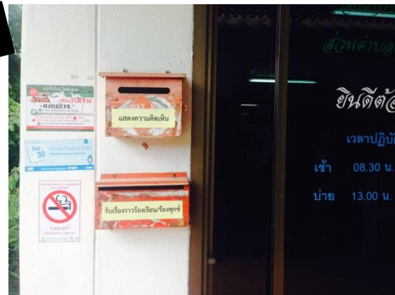
ยื่นผ่านกล่องรับเรื่องร้องเรียน/ร้องทุกข์