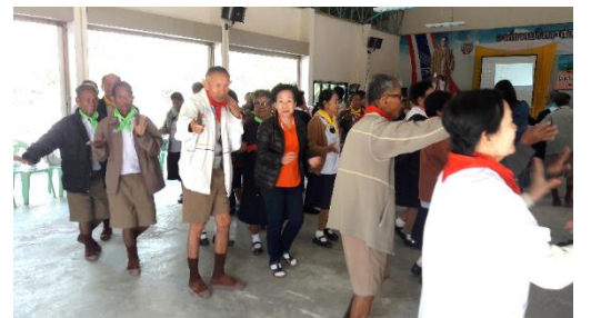
กิจกรรมสันทนาการ