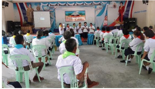
กิจกรรมการแสดงออก