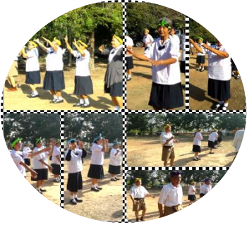
กิจกรรมการออกกำลังกาย และซ้อมเต้นบาสะโลบ