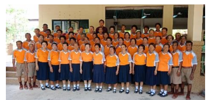
ภาพรวมรุ่นก่อนจบหลักสูตร