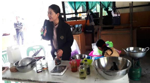
ให้ความรู้และสาธิตการทำน้ำยาล้างจาน สบู่ ยาลม่อง วิทยาการจากศูนย์ส่งเสริมอาชีพขอนแก่น